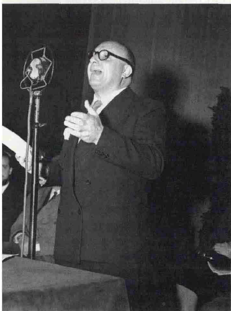
Mario Scelba, ministro degli Interni

Ma le indagini di Angrisani nulla possono contro la realpolitik di Scelba: l'8 maggio, il ministro degli Interni, dopo aver appreso della pista agrario-mafiosa dalle autorità di Pubblica sicurezza, dichiara al Giornale di Sicilia che «la magistratura procederà alla liberazione di coloro sui quali non gravano indizi sicuri di reità». La strage non è più politica: è un episodio di delinquenza comune, imputabile alla banda Giuliano. Agli inizi di settembre del '47 tutto sembra ricomposto: il nuovo governo De Gasperi nasce tra gli applausi delle destre, degli industriali e degli americani, Alessi in Sicilia governa con i liberal-qualunquisti e a Piana degli Albanesi, San Giuseppe Jato e San Cipirello, dirà Scelba «non vi sono state occupazioni di terra né esisteva uno stato di conflitto fra i proprietari terrieri e le organizzazioni di lavoratori». ■