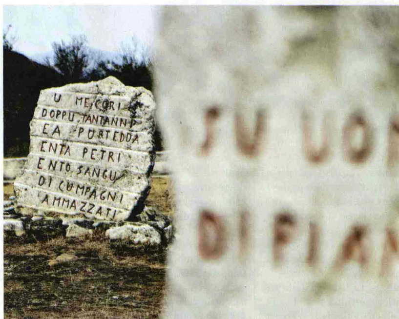
Un cippo commemora la strage di Portella della Ginestra